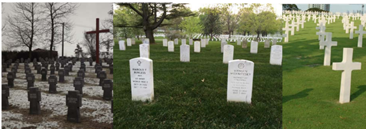
Obr. 5 – Rôzne typy náhrobných kameňov

mena, hodnosti, vyznamenaní, služobného čísla, náboženského znaku a osobného nápisu poskytnutého rodinou.