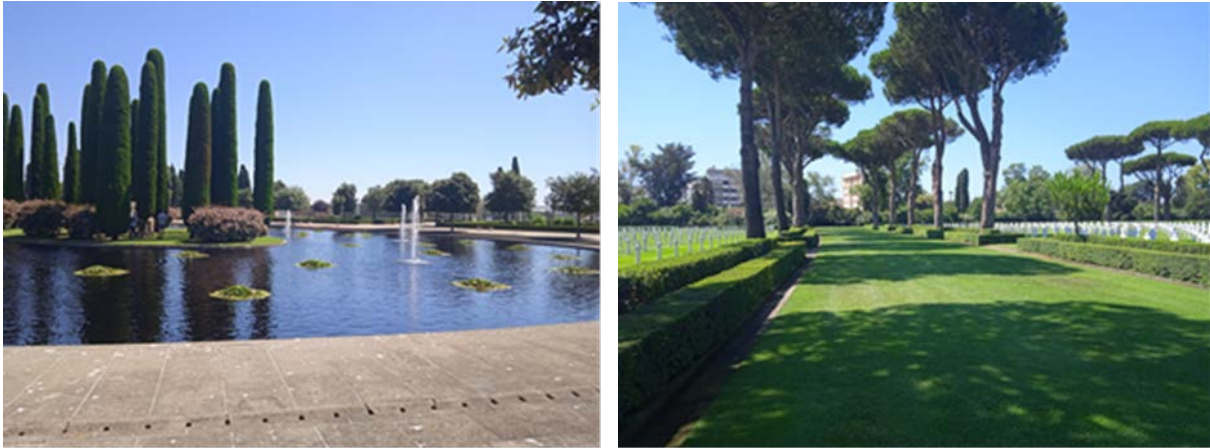
Obr. 7 – Záhradno-architektonická kompozícia vojnových cintorínov

pohrebiskách spočíval spočiatku najmä v jej symbolike a ako označovanie miest hrobov. Výber rastlín bol ovplyvnený ich symbolikou (večnosť, pomínelnosť, večná láska a pod.), používali sa najmä lípy, platany, tuje, tisy, brečtan, zimozeleň a ruže. Prvýkrát sa objavuje pri tvorbe pohrebísk aj požiadavka vzdelávať a pozdvihovať návštevníkov, a to aj prostredníctvom výberu rastlín (Halajová 2009, 2010, 2018, 2020).