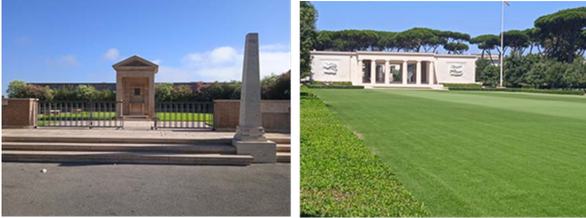
Obr. 6 – Drobna aj monumentálne architektúra vojnových cintorínov Zdroj: terénny výskum 2024, vojnové cintoríny v Anzio a Nettuno, Taliansko

Súčasťou areálov vojnových cintorínov bývajú aj stavebné a dekoratívne prvky – autentické a novodobé prvky drobnej architektúry (kaplnky, centrálné pomníky a centrálny kríž), spevnené plochy (cesty, chodníky, schodiská), náhrobníky a oplotenia s alebo bez vstupných brán.