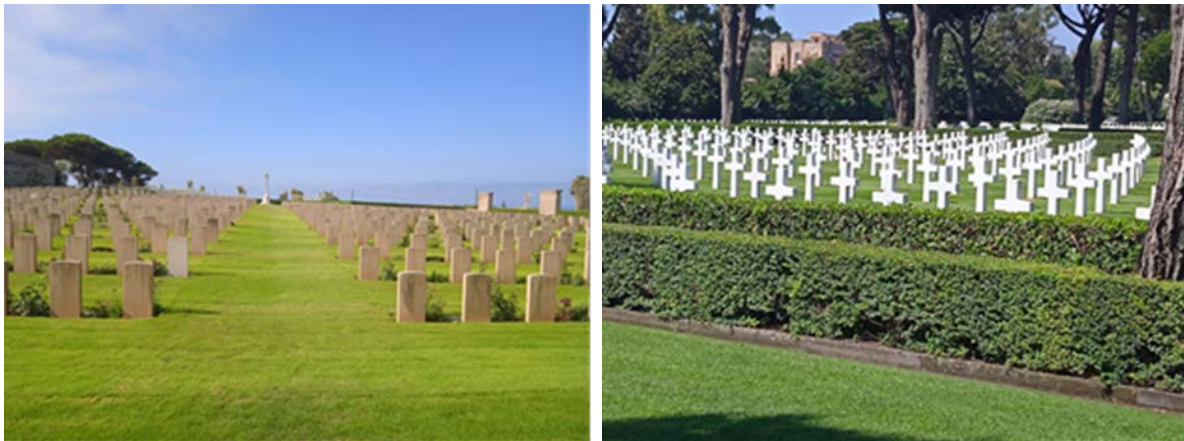
Obr. 1 – Priestorový koncept vojnových cintorínov

Vojnový cintorín predstavuje materializovanú formu piety prostredníctvom technických, architektonických a umeleckých prostriedkov.