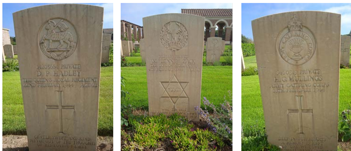
Obr. 4 – Spôsoby vyjadrenia osobných špecifik prostredníctvom symbolov

Napriek jednotnosti a unifikovanosti náhrobných kameňov je každý zdrojom osobných údajov a symbolov. Vyjadrujú národnú príslušnosť, vierovyznanie, vojenskú hodnosť a pod.